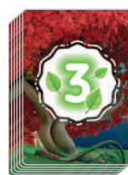
Стопка победных очков